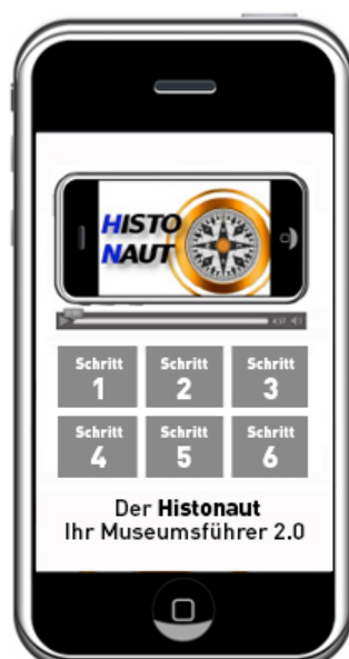
Vorschau im Histonaut